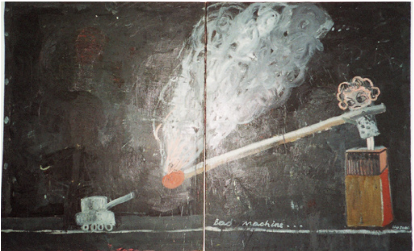
Armen Eloya, bad machine.

wijze de aanwezigheid van massavernietigingswapens in eigen land aan de kaak te stellen. Omdat de NAVO als militaire belangenbehartiger van de economie van het Westen conflicten in de wereld meer en meer militariseert en de bestaande oneerlijke machts- en welvaartsverhoudingen vergroot. Hoewel de focus van de afgelopen actie breder lag dan de kernwapenpolitiek werd ook ditmaal gegrepen naar het middel van de burgerlijke ongehoorzaamheid door strikt geweldloos te pogen het NAVO hoofdkwartier binnen te dringen. Afgelopen Zaterdag 22 maart organiseerde het Belgische Forum voor Vredesactie een massale actie van burgerlijke ongehoorzaamheid bij het NAVO hoofdkwartier in Brussel. In aanloop naar de NAVO top over de toekomst van het militaire bondgenootschap die enkele weken later in Boekarest zou plaatsvinden en ongeveer 5 jaar na de inval van Irak probeerden honderden vredesactivisten het NAVO hoofdkwartier binnen te dringen om deze symbolisch te sluiten. Onder de deelnemers waren mensen uit 17 verschillende landen. Uiteindelijk deden er volgens de organisatie 800, volgens de politie van Brussel 1000 mensen mee, waarvan er ongeveer 500 werden gearresteerd. Het grootste deel van de deelnemende vredesactivisten werd al buiten de basis