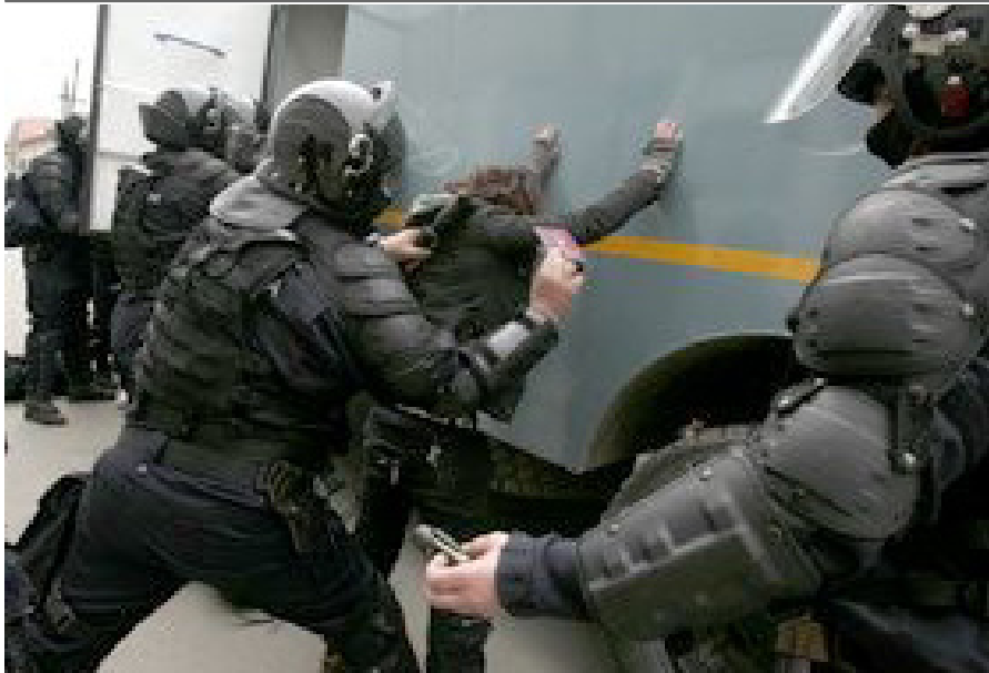
Arrestaties van demonstranten in Brussel, 22 maart 2008

aangehouden, maar ongeveer 50 van hen lukte het om ondanks de grote inzet van politie en militairen tot het NAVO complex door te dringen. Onder hen 25 van de ongeveer 100 Nederlanders, die met een tweetal bussen en op eigen gelegenheid naar Brussel waren gekomen. Volgens Vredesactie dreigde de politie zelfs de deelnemers van een literaire wandeling rond het NAVO-complex op te pakken. Het ging hier om een "niet-ongehoorzame" demonstratiegroep van onder meer schrijvers die mee protesteerden tegen de afhankelijkheid van België van de NAVO. In de loop van de avond werden