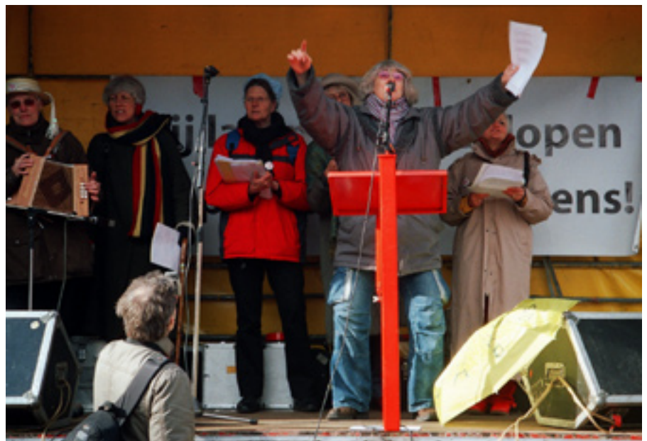
24 maart: The Raging Grannies op het Plein: ALLEMAAL MEEZINGEN!!!