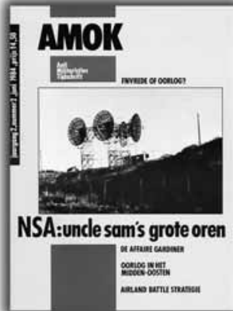
VOORPAGINA UIT 1984

Zoals vele inlichtingendiensten heeft de NSA een dubbele taak, één ten aanzien van de vijand en één ten aanzien van de eigen strijdkrachten. De eerste taak wordt in het dieventaaltje van de inlichtingendiensten aangeduid als COMINT (Communications Intelligence) hetgeen kan worden gedefinieerd als het onderscheppen en verwerken van buitenlands communicatieverkeer via radio, kabel of andere elektromagnetische