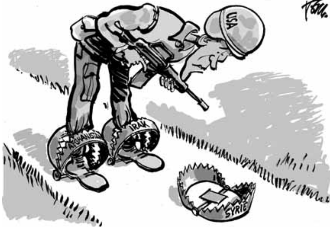
Tekening: Tom Janssen / Dagblad Trouw