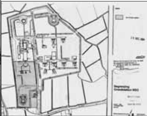
BOUWTEKENING GRONDSTATION NSO

De taken van NSO zijn drieledig: het verwerven van verbindingsinlichtingen