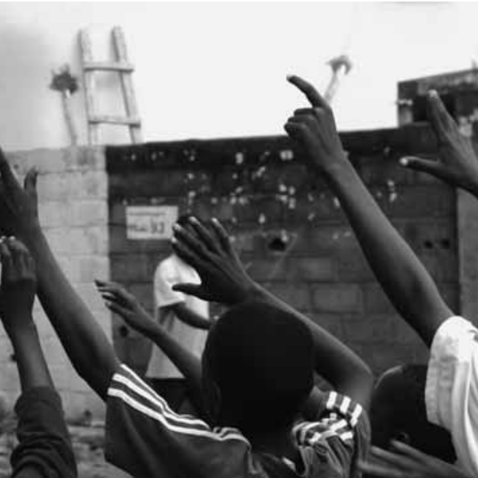
OEFENING FLINTLOCK. BAMAKO, MALI 2007

in de hoofdstad. “De extremisten willen nog steeds Mali overnemen,” verzekert hij. Hij is hoofd van de landelijke Organisatie van Jonge Moslims. “De wahabieten en de salafisten zijn handlangers van de terroristen.” En wijst op de trainingscentra bij de wahabietische moskeeën in Bamako. “Die doen aan ideologische manipulatie. Ze houden er een soort militie op na. Ze manipuleren met hun ophitsende taal ongeschoolde en werkloze jongeren en werken aan de expansie van de Arabische invloed in Afrika. In de Arabische wereld wordt nog steeds gedacht dat Afrikaanse moslims geen echte moslims zijn.”