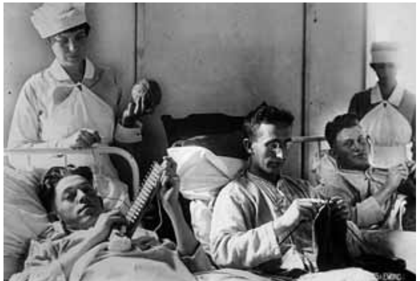
WASHINGTON D.C. 1917