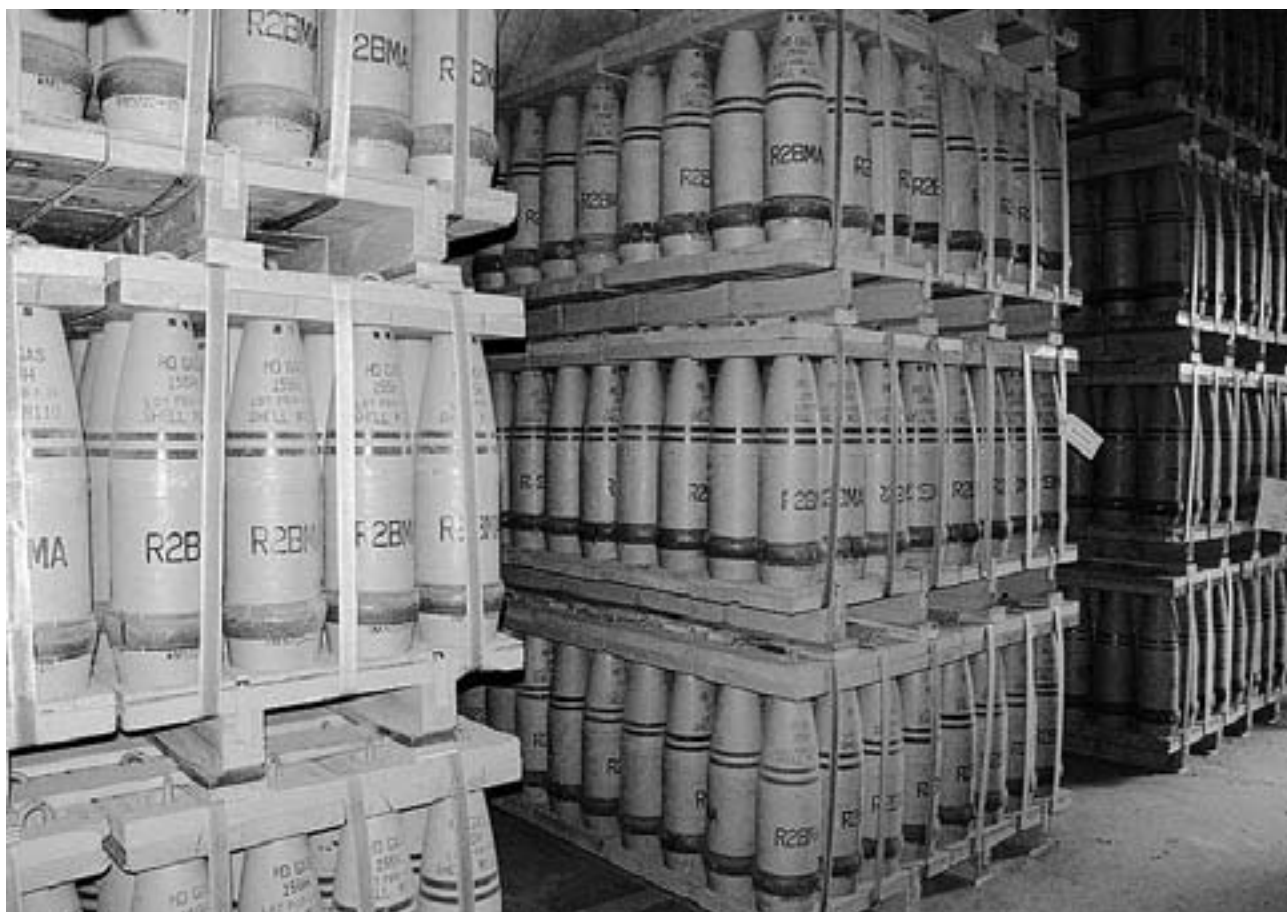
OPSLAG VAN MOSTERD GASGRANATEN IN BLUE GRASS ARMY DEPOT IN KENTUCKY

drag is in 1997 van kracht geworden. Vijf landen – de VS, Rusland, Zuid-Korea, India en Albanië misten de deadline van 2007. Twee jaar geleden kregen de VS, Rusland en Libië (dit laatste land had zich pas later aangesloten) opnieuw uitsstel van de al eerder verlengde uiteindelijke termijn.