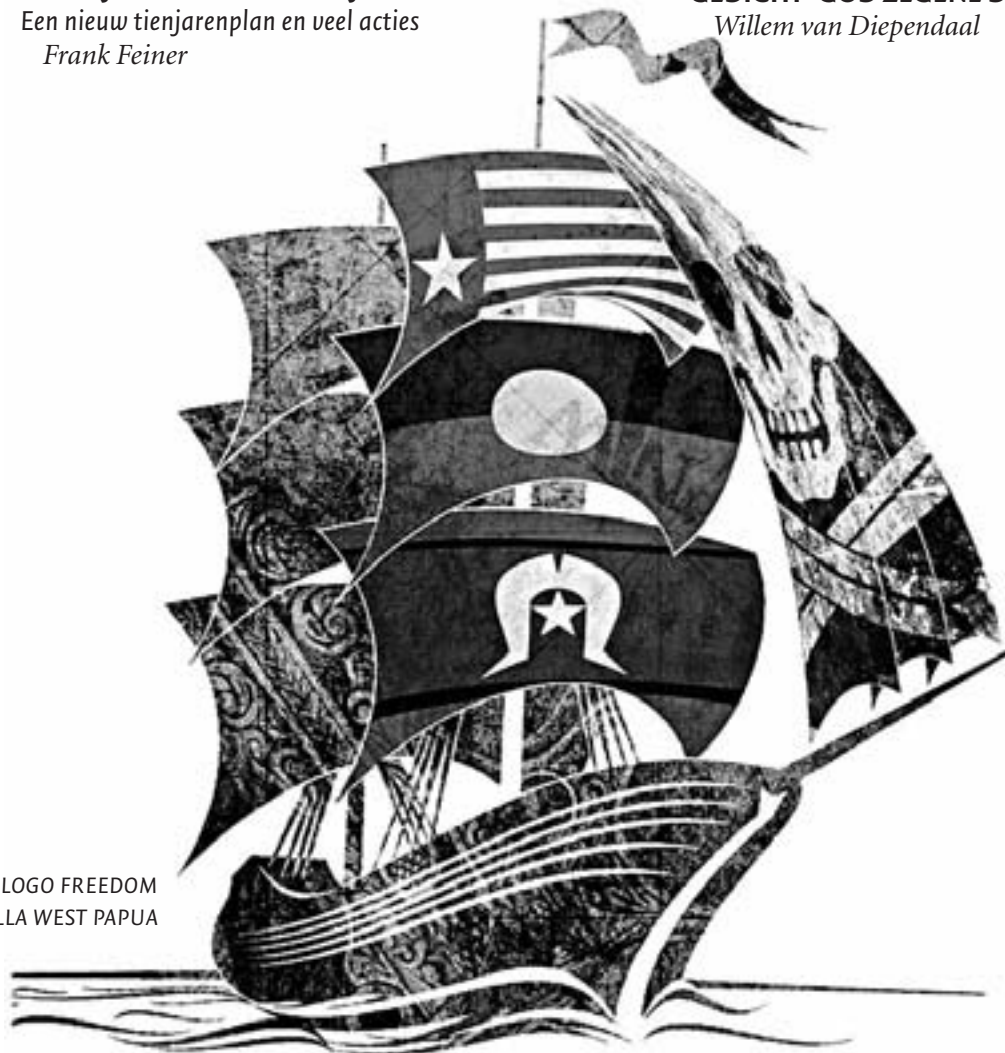
LOGO FREEDOM FLOTILLA WEST PAPUA