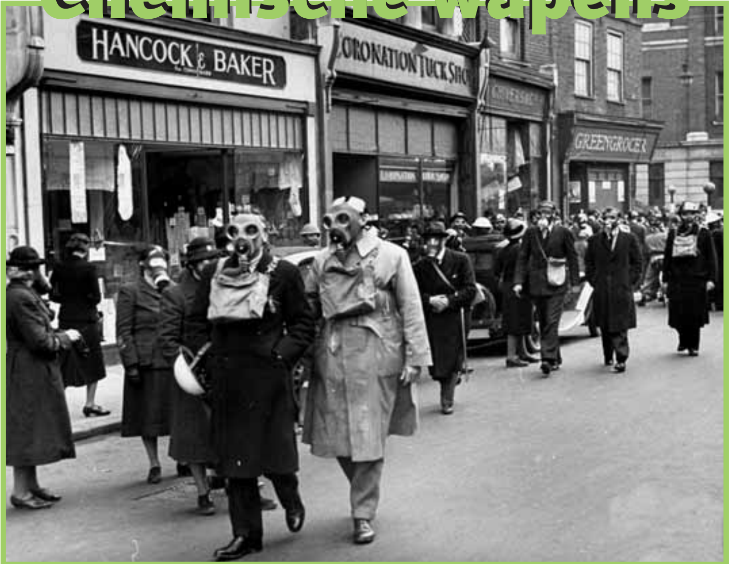
LONDEN TIJDENS DE TWEDE WERELDOORLOG

Gifgasgebruik in de Irak-Iranoorlog • Sarin van Syrië resultaat van angst • Korte geschiedenis van gifgas • Moeizame ontwapening van supermachten • Een chemische waakhond in Den Haag • Overzicht chemische wapens